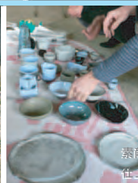
素敵なお色に 仕上がりました