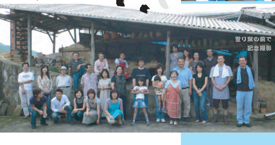
登り窯の前で 記念撮影

いかにしてあそぶか どうやってたのしむか 誰になんと言われようとも 自分自身を信じて その気持ちがみんなに伝わって