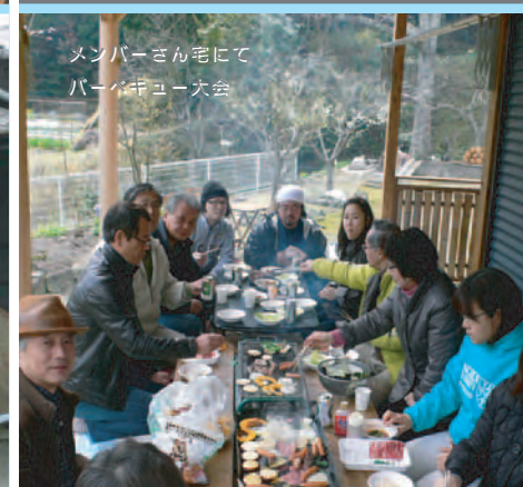
メンバーさん宅にて バーベキュー大会