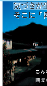
こんな自然に 囲まれて陶芸を